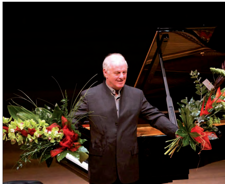
Daniel Barenboim, II Rubinstein Piano Festival 2011.

W mojej ocenie, jako pomysłodawcy i dyrektora festiwalu, zyskał on stabilizację artystyczną i mimo trudności z wielu stron, a nawet zagrożenia odebrania go fundacji – widocznie i stale się rozwija. Na wystawach towarzyszących tegorocznemu festiwalowi, zaprezentowano wiele zdjęć dokumentujących te pozytywne opinie oraz obecność największych pianistów świata.